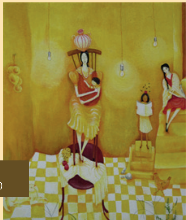
Detalle de Mural/ Con el permiso de Eva... Jalapa, San Pedro Pinula. 2010