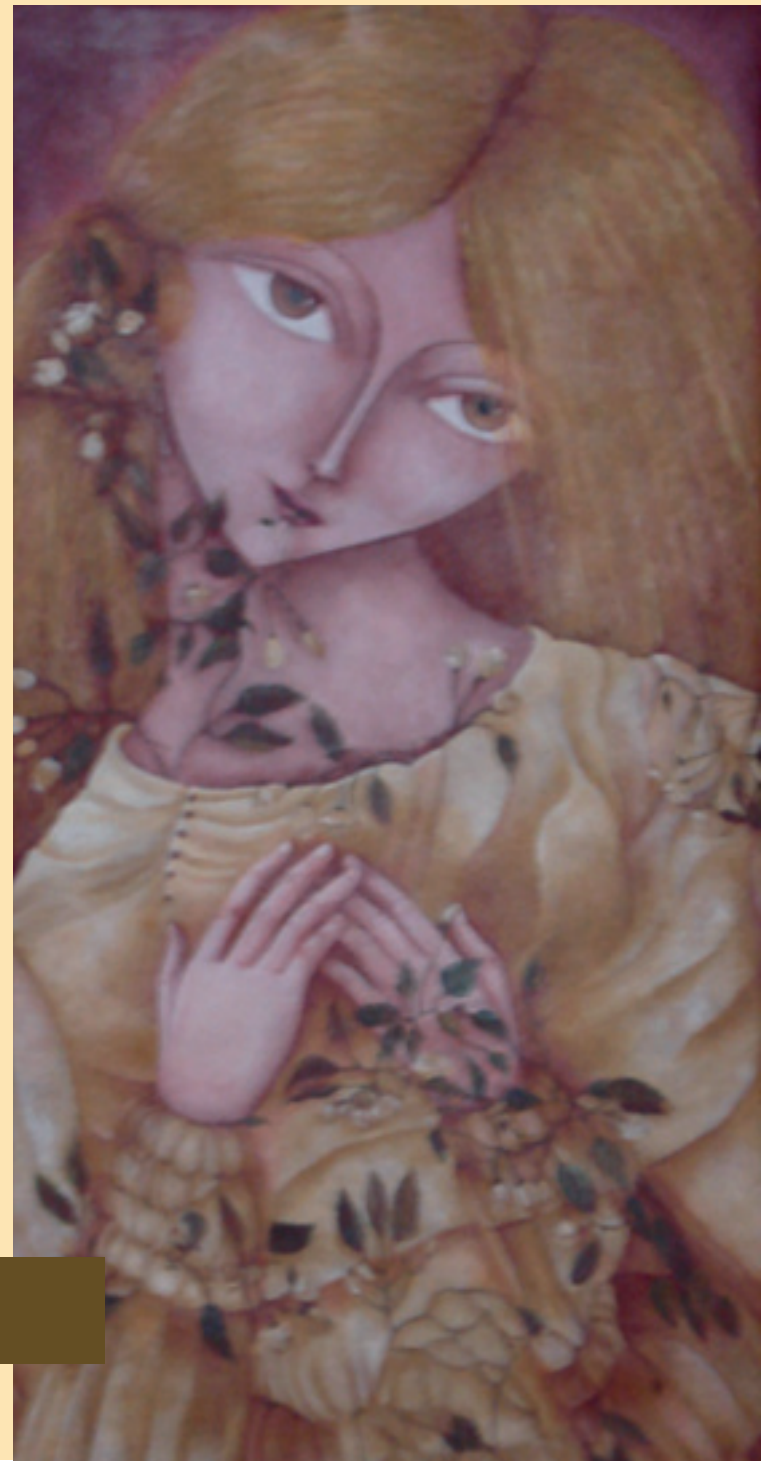
Enredadera Óleo sobre boldo

De alguna manera perseguida por el amarillo, los vestidos transparentes, los pasos cortos, la piel limpia, joven, vieja de recuerdos, con un vientre de