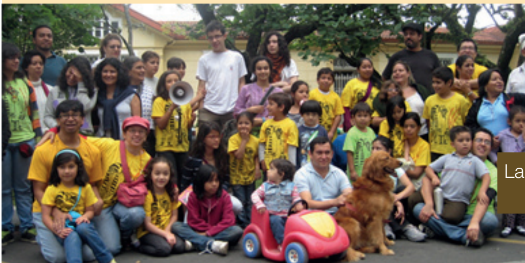
La familia de la Escuela de Arte Frida Kahlo

Me calculo principiante, alumna de la vida y los