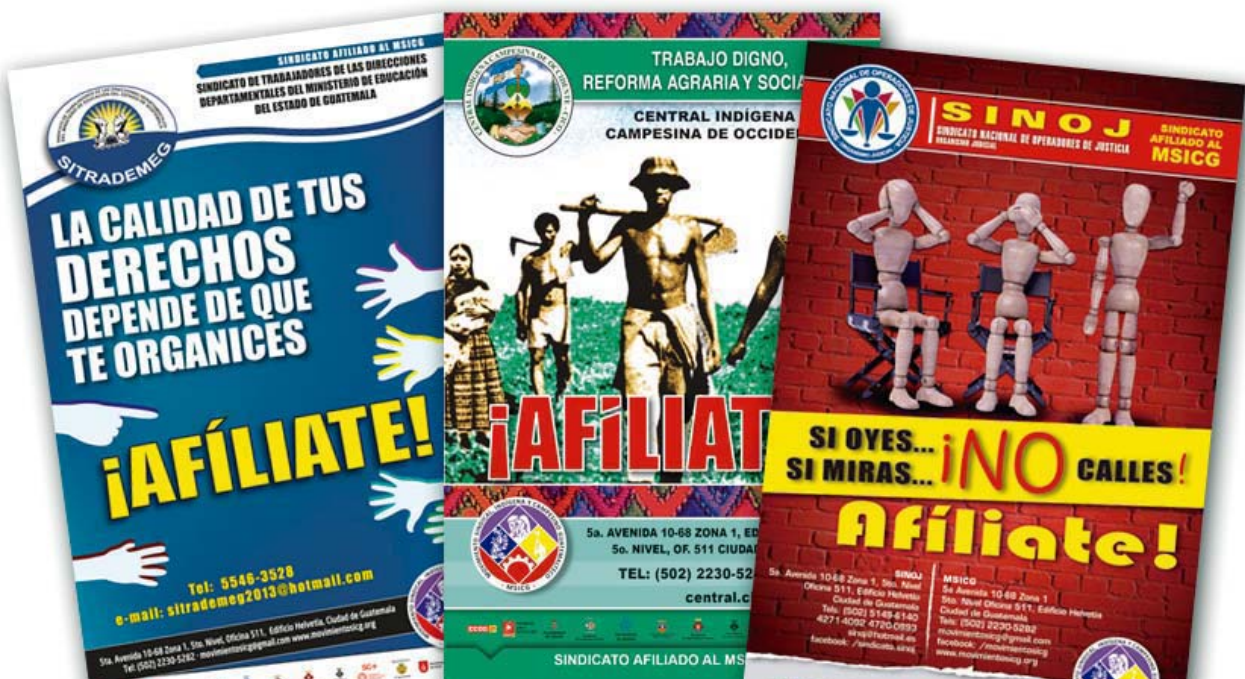
Afiches utilizados durante las campañas de afiliación.