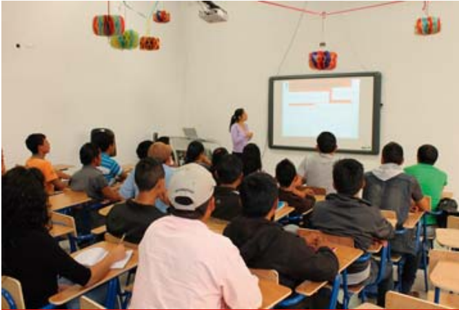
Taller: Comunicación e incidencia social