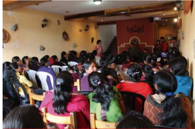
Taller: Hacia nuestro concepto de Trabajo Digno