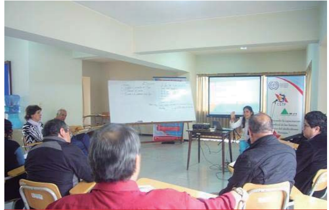
Taller con Dirigentes de CGTP-PERU

Dicho acercamiento político se fortaleció, por un lado con las experiencias acumuladas de los y las compañeras de CCOO pues compartimos mucho de nuestra historia de lucha por la construcción de un futuro mejor y de la represión que en sus inicios pretendió trancar a nuestros hermanos sindicalistas de Catalunya que es la misma que se emplea hoy día contra el MSICG para trancar la construcción de un Estado de Bienestar como el que los compañeros han construido para su pueblo; y por el otro, con el apoyo y el intercambio de experiencias por parte de los Ayuntamientos Catalanes en la promoción de los derechos humanos en el mundo, la democracia y el fortalecimiento del Estado de derecho. En ese marco el MSICG valora profundamente el apoyo que recibe de los sindicalistas catalanes, de los distintos Ayuntamientos y de la Fundación Paz y Solidaridad de Cataluña.