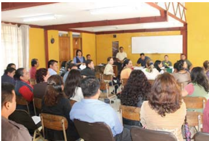
Taller: Trabajo e Inclusión Social