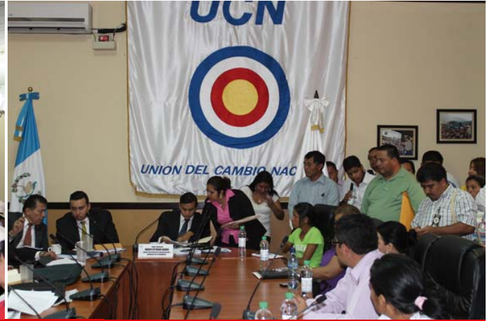
Entrega de iniciativas de ley del MSICG a Parlamentarios