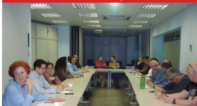
Reunión del MSICG con dirigentes de COMFIA