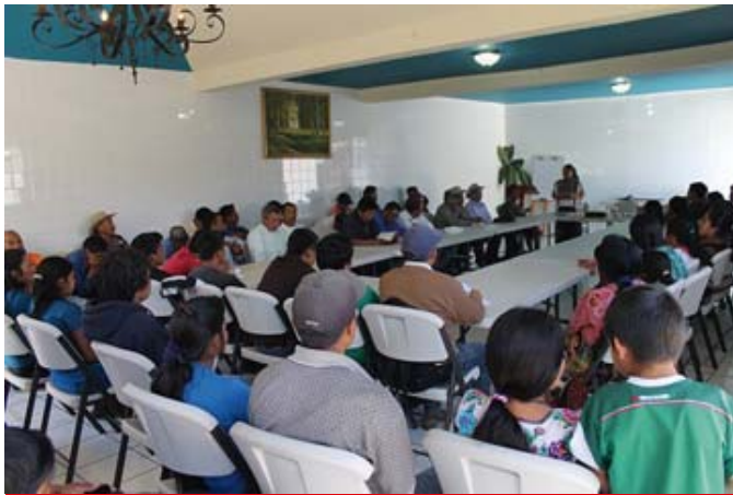
Taller: Problemática Estructural