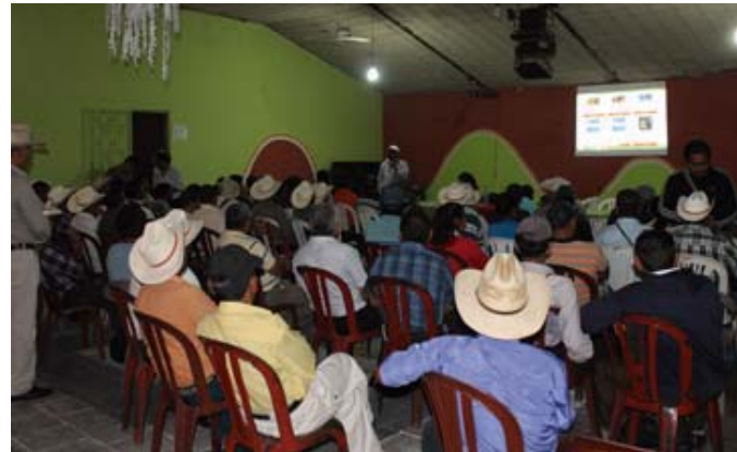
Taller: La transformación de la sociedad, el objetivo fundamental del sindicalismo

en el mes de mayo de 2014 en el que se priorizaron las principales líneas de acción a impulsar por el MSICG para la incorporación plena de las mujeres en condiciones dignas al trabajo asalariado.