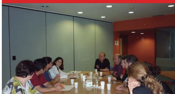
Reunión del MSICG con dirigentes de CCOO-Catalunya