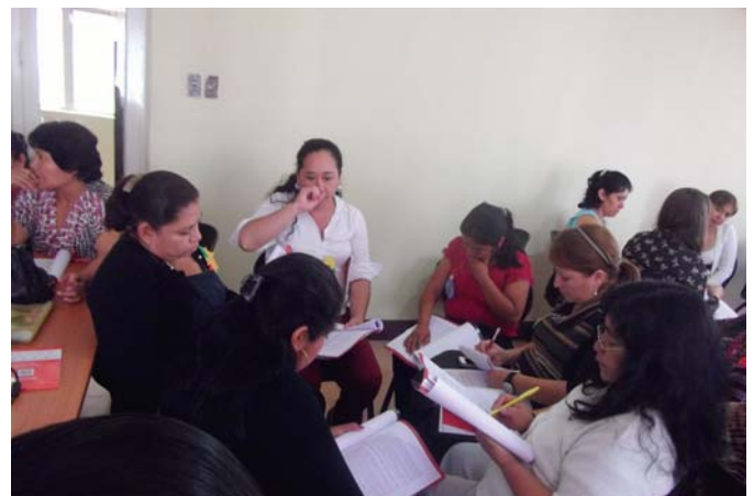
Mesas de trabajo, Coordinadora de la mujer