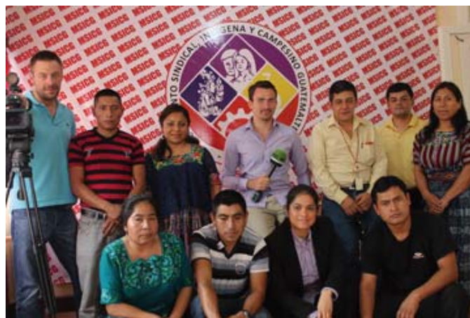
Visita de RT al MSICG

El MSICG desea agradecer profundamente a los compañeros y compañeras de los distintos medios de comunicación social quienes de manera constante durante el año 2014 acompañaron las luchas que realiza la Central Sindical en defensa de la clase trabajadora del país, sabemos que para muchos de nuestros compañeros y compañeras trabajadoras