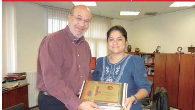
Entrega de reconocimiento a Secretario General de CCOO-Catalunya