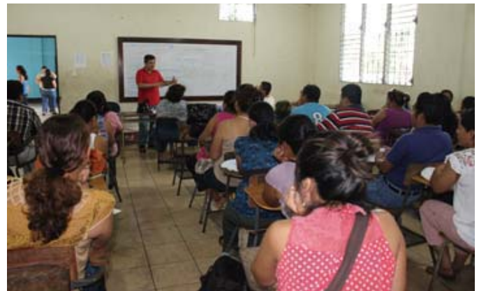
Taller: Mecanismos de defensa para combatir la precarización laboral de los contratos de trabajo