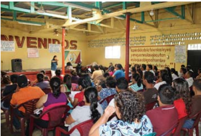
Taller: Sindicalismo y Negociación Colectiva