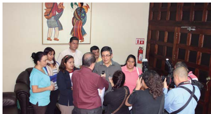
MSICG presenta Acción de Inconstitucionalidad contra Ley Monsanto

Durante el año 2014 el MSICG continuó profundizando los lazos de hermandad con el sindicalismo mundial comprometido con los intereses de los trabajadores y trabajadoras abonando de esta manera a profundizar la internacionalización del sindicalismo clasista tan imprescindible frente al modelo económico y social imperante en el mundo.